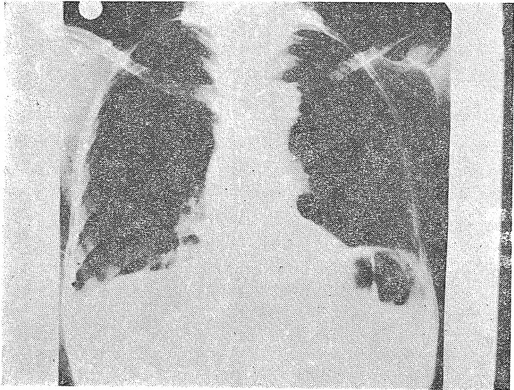
Resim - 2